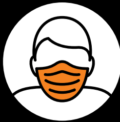
Maskenpflicht im ganzen Kino.