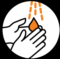
Gründlich Hände waschen.